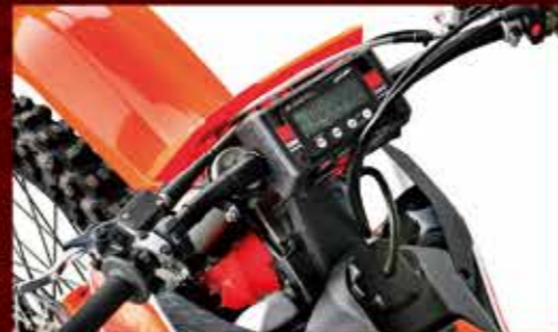
◀ X-LAP 28.6mmタイプ 品番:D3155 価格(税込):¥11,000