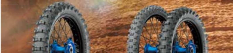
MICHELIN STARCROSS 6 MUD