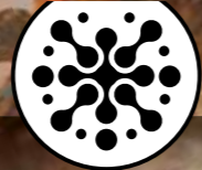
MICHELIN STARCROSS 6 SAND