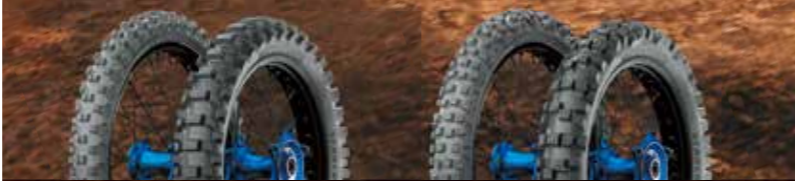
MICHELIN STARCROSS 6 MEDIUM HARD