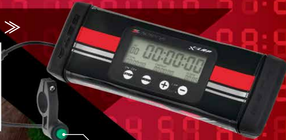
押しやすいプッシュボタン